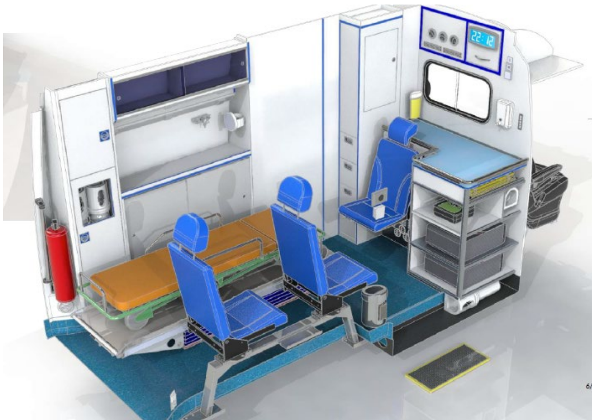
Optie 6 uitvoering van front-/hoekmeubel en zijwand meubel