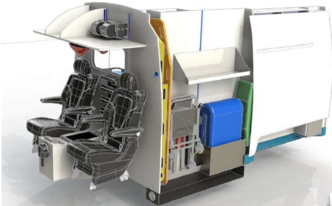
Optie 6 uitvoering